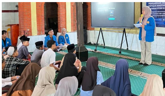
Gambar 4. Sesi Ice Breaking

Kegiatan ditutup dengan sesi ice breaking yang digunakan sebagai media evaluasi terhadap tingkat pemahaman peserta atas materi yang telah disampaikan. Pada sesi ini, peserta diberikan pertanyaan terstruktur yang berkaitan dengan pengelolaan keuangan pribadi dan kebiasaan menabung. Peserta yang memberikan jawaban kurang tepat diminta untuk menjelaskan kembali materi secara singkat sebagai bentuk penguatan pemahaman. Pendekatan ini bertujuan untuk memperkuat pemahaman peserta sekaligus menciptakan suasana pembelajaran yang partisipatif dan kondusif.