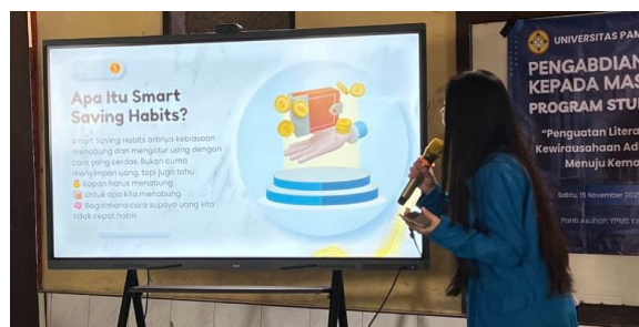
Gambar 2. Edukasi Smart Saving Habits

Kegiatan diawali dengan pemberian edukasi kepada generasi muda Panti Asuhan YPMS mengenai konsep dasar pengelolaan keuangan pribadi. Materi yang disampaikan mencakup pengertian menabung ( saving ), pentingnya pembentukan kebiasaan menabung sejak dini, serta pemahaman mengenai perbedaan antara kebutuhan dan keinginan dalam pengambilan keputusan keuangan. Selain itu, peserta diperkenalkan dengan metode pengelolaan keuangan 50/30/20 sebagai pendekatan sederhana dalam mengalokasikan uang saku. Edukasi disampaikan oleh mahasiswa menggunakan media presentasi ( powerpoint ) yang disusun secara sistematis dan komunikatif. Selama kegiatan berlangsung, penyampaian materi dilakukan secara interaktif dengan melibatkan peserta melalui stimulus pertanyaan terarah yang berkaitan dengan kebutuhan, keinginan, serta pengelolaan uang saku dalam kehidupan sehari-hari.