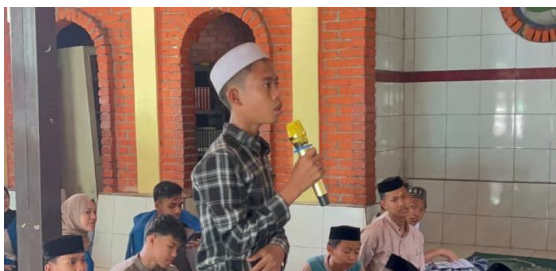
Gambar 5. Evaluasi Pemahaman Peserta