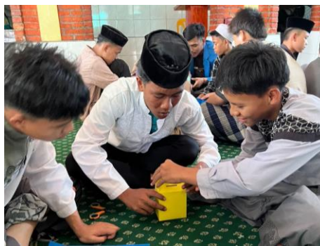
Gambar 3. Simulasi Budgeting

Setelah sesi edukasi, kegiatan dilanjutkan dengan praktik dan simulasi budgeting sederhana menggunakan metode amplop. Pada tahap ini, tim pengabdian menyediakan template amplop sebagai media pembelajaran. Peserta dibagi ke dalam beberapa kelompok untuk merangkai dan menyiapkan amplop sesuai dengan kategori pengeluaran, yaitu kebutuhan, keinginan, dan tabungan. Selanjutnya, tim pengabdian membagikan kertas yang telah diberi nominal uang sebagai ilustrasi uang saku. Peserta diarahkan untuk menghitung serta mengalokasikan nominal tersebut ke dalam masing-masing amplop berdasarkan prinsip pengelolaan keuangan metode 50/30/20. Melalui kegiatan ini, peserta memperoleh pengalaman langsung dalam menyusun perencanaan keuangan sederhana secara terstruktur.