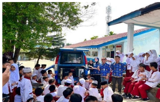
Gambar 2 Foto Kegiatan Pameran SD 60 Palembang