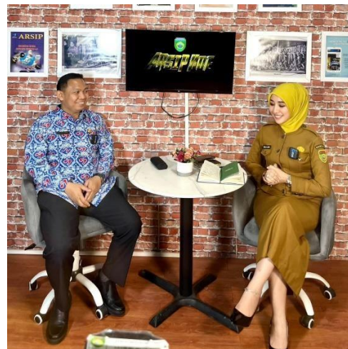
Gambar 2 Foto Podcast Dinas Kearsipan Provinsi Sumatera Selatan

Peran Humas (Hubungan Masyarakat) dalam kegiatan media digital oleh Dinas Kearsipan Provinsi Sumatera Selatan adalah sebagai perancang komunikasi strategis yang bertugas menjembatani nilai sejarah arsip dengan audiens modern. Humas bertindak sebagai produser konten