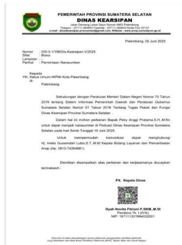
Gambar 1 Foto Surat Permintaan Narasumber

Terdapat surat permintaan narasumber, dimana surat ini akan dikirim/disampaikan kepada pihak terkait.