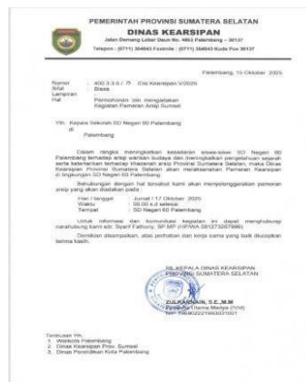
Gambar 1 Surat Keluar