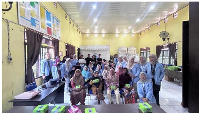
Gambar 4. Sesi dokumentasi bersama kelompok Mahasiswa KKN Kelompok 33 dan warga Desa Jambu pasca-penyampaian solusi terpadu penguatan ekonomi.

program pengentasan kemiskinan desa. Rangkaian kegiatan pengabdian ini ditutup dengan sesi foto bersama sebagai wujud komitmen kolektif warga dalam mendukung penguatan ekonomi dan ketahanan keluarga.