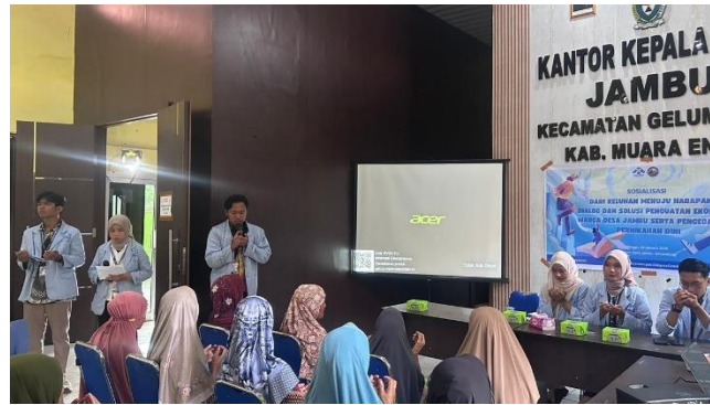
Gambar 1. Suasana pembukaan kegiatan sosialisasi di Kantor Kepala Desa Jambu yang dihadiri oleh perangkat desa, orang tua, dan remaja.