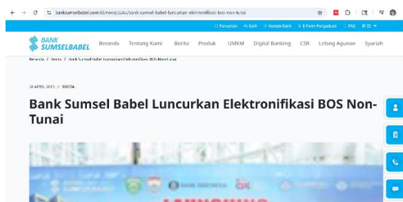
Gambar 1.4 Bank daerah Sumsel Babel meluncurkan elektronifikasi BOS non-tunai.

Berdasarkan hasil observasi, peneliti melihat secara langsung bahwa SD Negeri 136 Kota Palembang telah menerapkan sistem pengelolaan keuangan berbasis digital dan non-tunai melalui kerja sama dengan Bank Sumsel Babel. Sistem tersebut digunakan dalam proses pencairan dan pelaporan dana BOS secara elektronik. Selain itu, sekolah juga terlihat melakukan penyusunan laporan keuangan secara tertib melalui dokumen RKAS, BKU, SPJ, dan laporan realisasi penggunaan dana sekolah yang tersimpan dengan baik sebagai bentuk administrasi dan pertanggungjawaban keuangan.