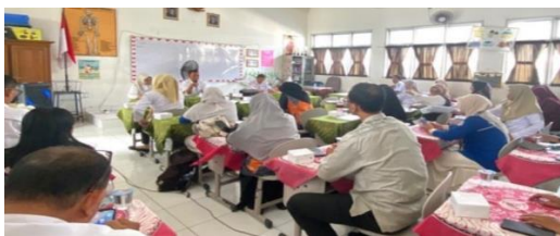
Gambar 1.5 Pelibatan tenaga kependidikan sekolah dalam memahami terlaksananya pengelolaan keuangan sekolah.

Hasil dokumentasi menunjukkan adanya kegiatan evaluasi dan pengawasan pengelolaan keuangan yang dilakukan secara rutin di SD Negeri 136 Kota Palembang. Dokumentasi tersebut memperkuat hasil wawancara bahwa sekolah telah menerapkan prinsip transparansi dan akuntabilitas melalui pengawasan, evaluasi, serta keterbukaan informasi dalam pengelolaan keuangan sekolah.