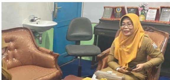
Gambar 1.2 Tahap perencanaan penyusunan Rencana Kegiatan dan Anggaran Sekolah (RKAS) di SD Negeri 136 Kota Palembang.

Hasil dokumentasi menunjukkan bahwa sekolah telah melaksanakan pengelolaan keuangan pendidikan secara tertib melalui penyusunan RKAS, pencatatan BKU, penyimpanan SPJ, serta penyusunan laporan penggunaan dana sekolah secara berkala. Dokumentasi tersebut memperkuat hasil wawancara dan observasi bahwa seluruh tahapan pengelolaan keuangan pendidikan di SD Negeri 136 Kota Palembang telah berjalan sesuai prosedur dan mendukung kelancaran program sekolah.