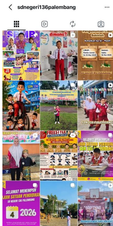
Gambar 1.1 Pelaksanaan pembinaan OSIS, ekstrakurikuler, dan perlombaan, serta Mengelola dan menggunakan dana yang dialokasikan khusus untuk kegiatan siswa berjalan dengan baik dan kompeten.

Berdasarkan hasil observasi, peneliti melihat secara langsung bahwa pengelolaan kegiatan kesiswaan di SD Negeri 136 Kota Palembang berjalan dengan baik dan terorganisasi. Kegiatan pembinaan OSIS, ekstrakurikuler, dan perlombaan siswa dilaksanakan secara aktif dengan dukungan pengelolaan dana yang tertib dan terencana. Selain itu, sekolah juga rutin melakukan evaluasi terhadap penggunaan anggaran sehingga seluruh kegiatan siswa dapat berjalan secara efektif dan sesuai dengan kebutuhan sekolah.